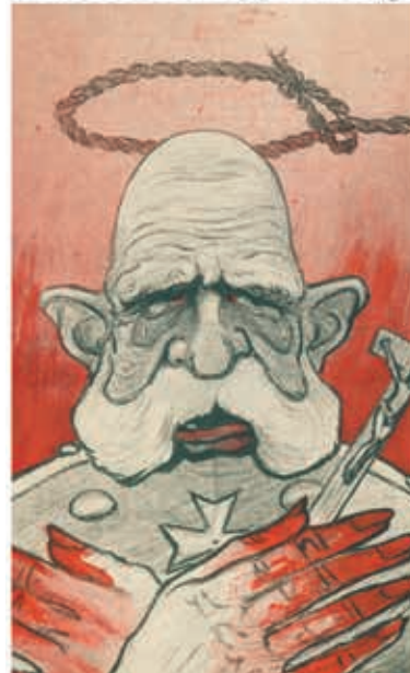
IL SOTTO CAPO