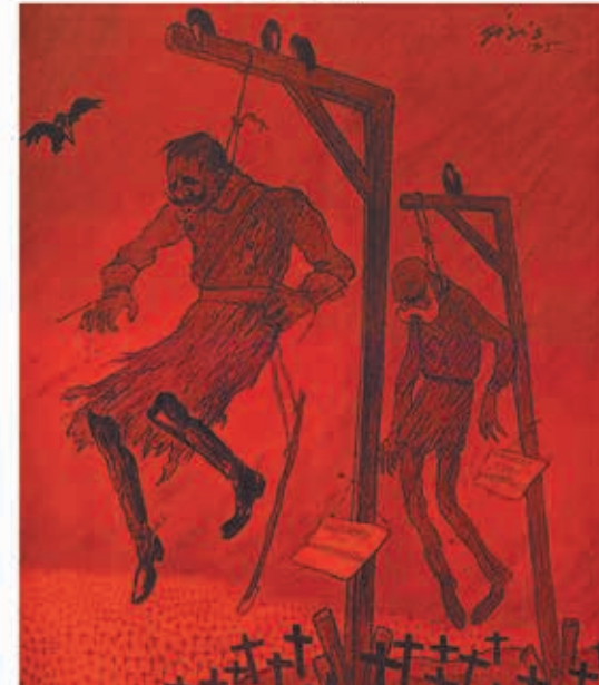
L'ALBA DEL 1916