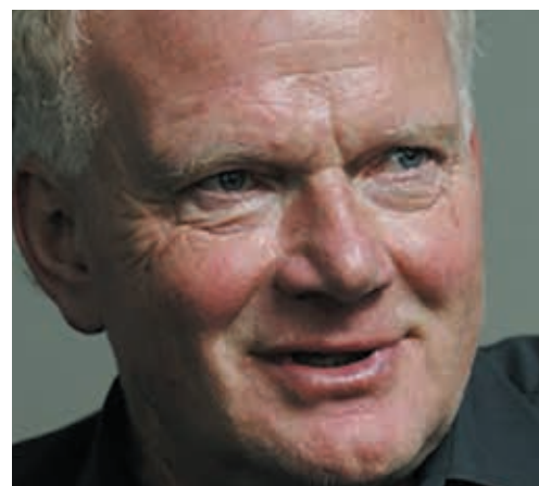
Il sociologo Ulrich Beck terrà una lectio magistralis su «come salvare il progetto europeo» attraverso un nuovo «approccio cosmopolita».

Quando ho cominciato a scrivere A un cerbiatto somiglia il mio amore sapevo di voler raccontare la storia di Israele che da più di cento anni - ancor prima che diventasse una nazione - si trova in uno stato di guerra. E sapevo che l'avrei raccontata attraverso la storia privata, intima, di una famiglia. [...]. Ai miei occhi i momenti più significativi della storia non sono avvenuti sui campi di battaglia, in sale di palazzi o di parlamenti bensì in cucine, in camere da letto matrimoniali o in quelle dei bambini. In A un cerbiatto ho cercato di descrivere la lotta che persone intrappolate