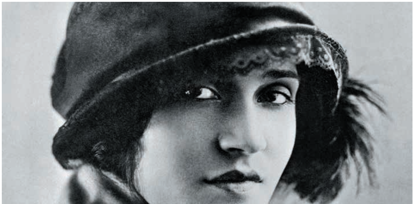
Tina Modotti a San Francisco (1920 ca.). Questo l'epitaffio scritto da Pablo Neruda e scolpito sulla tomba di Tina al Pantheon di Dolores, a Città del Messico: Tina Modotti, sorella tu non dormi, no, non dormi:/ forse il tuo cuore sente crescere la rosa/ di ieri, l'ultima rosa di ieri, la nuova rosa./ Riposa dolcemente sorella.

noi non dobbiamo mancare, né fermarci a metà del cammino. Fermarsi è ormai impossibile, la nostra coscienza e la memoria delle vittime non ce lo consentono». All'Università Autonoma di Città del Messico il 3 dicembre 1930 si inaugura una rassegna delle sue opere, che si trasforma in atto rivoluzionario per il contenuto e la qualità delle fotografie.