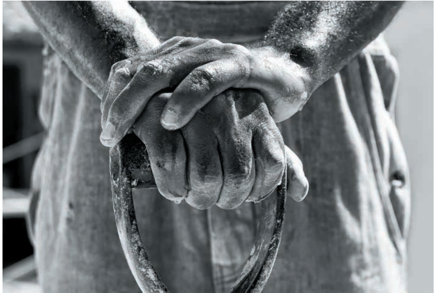
Tina Modotti, Manos con pala (periodo 1923-27)