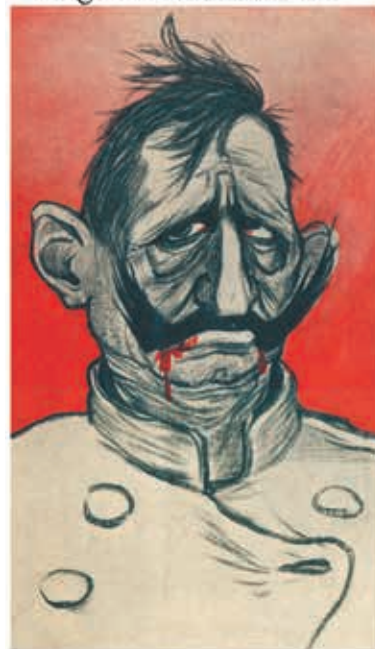
IL CAPO BANDA