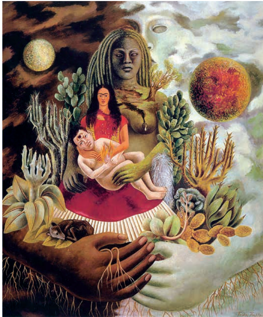
Frida Kahlo, L'amoroso abbraccio dell'universo , 1949.

te che gridava. Non provavo niente, non mi rendevo conto della situazione, non mi faceva male da nessuna parte perché mi stavo staccando dalla vita. Però mi stupiva che mi chiamassero "la ballerina"... prima dell'apocalisse, accanto a me se ne stava seduto un artigiano con un sacchetto di polvere d'oro in grembo. Dopo ero completamente nuda e ricoperta d'oro. La ballerina dorata in mezzo ai cadaveri.../...un corrimano di quattro metri mi era entrato nel fianco. Mi aveva trafitto come la spada trafigge il toro. Mi aveva impalata. La punta scheggiata mi usciva dalla vagina. Sono stata stuprata da un corrimano a diciott'anni, su quell'autobus che avrebbe dovuto uccidermi sotto una pioggia d'oro» (Cacucci, pp. 9-10).