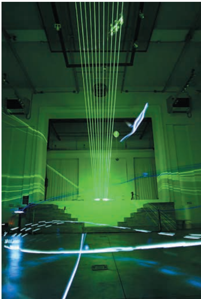
Arpa di luce, Pietro Pirelli

Una serie di sculture, composte da una lastra di vetro e da una bobina Tesla, sospese sul soffitto, formano Impacts , l'installazione di Alexandre Burton. I visitatori che si avvicinano alle sculture provocano, per la sola prossimità, archi di luce di varia intensità e, nello stesso tempo, impronte ritmiche generate dalle interazioni dell'elettricità con la lastra di vetro. La Damassama di Leonore Mercier è un anfiteatro di campane tibetane che lo spettatore, grazie all'uso di sensori, fa suonare, creando composizioni personalizzate. Nel corso della singolare esperienza, le vibrazioni paiono invitarci all'ascolto di una dimensione spirituale di cui siamo noi stessi provocatori. La balançoire di Veaceslav Druta è una installazione sonora interattiva prodotta, come la maggior parte delle opere qui presentate, da Le Fresnoy (Studio national des arts contemporains), dove l'artista moldavo è stato a lungo in residenza. Siamo invitati ad