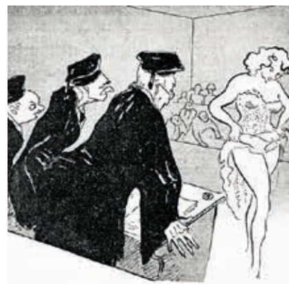
I GIUDICI: - LA PROVA È SENZ'ALTRO CONVINCENTE SIGNORINA...