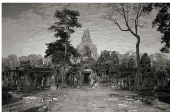
Kenro Izu, Angkor #79, Cambodia, 1994, dalla serie "Territorio dello spirito", stampa al platino, 35,5x51 cm.