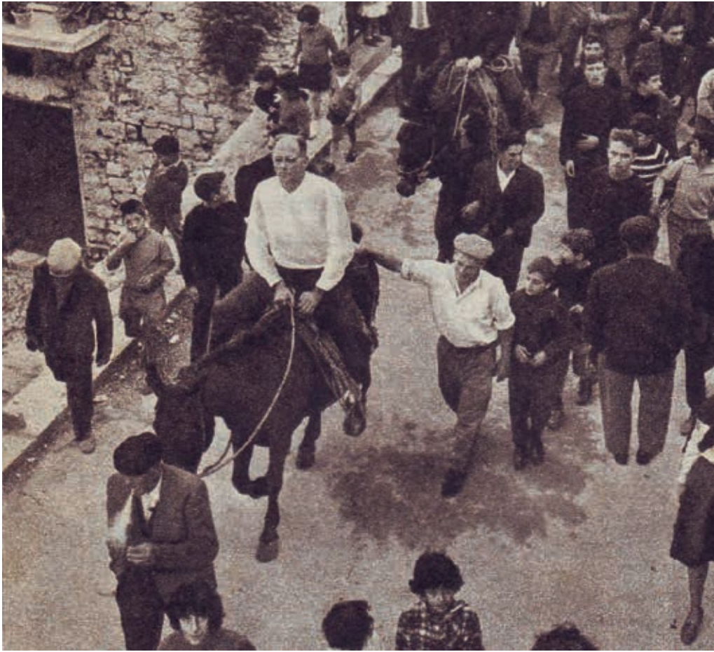
Sciopero per lacqua, Garcia Roccamena, 1965.