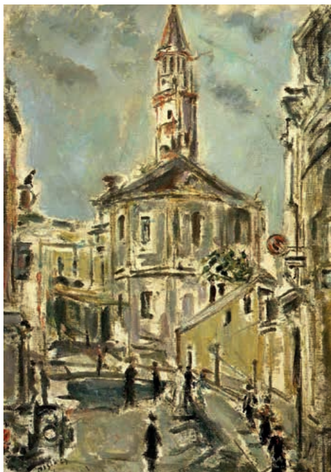
Filippo De Pisis, Milano, 1947 .

Intanto, è in preparazione la seconda delle grandi esposizioni previste da Ferrara Arte: La rosa di fuoco , rassegna che sarà inaugurata il 19 aprile, in concomitanza con l'Expo milanese. La mostra si ispira alla lontana Expo di Barcellona 1888 che celebrava lo sviluppo della città catalana, in ascesa, nonostante la difficile situazione sociale, culminante nella cosiddetta "settimana tragica" del 1909, con scontri di piazza e morti. Un fervore che infiammò tutte le arti, comprese musica e architettura. Fra i protagonisti, Picasso e Gaudì (in mostra anche rari disegni), e altri artisti meno conosciuti, ma tutti rappresentanti di prim'ordine di quel periodo. Per i dettagli dell'allestimento, attendiamo tre-quattro settimane e saremo in grado di fornirli ■